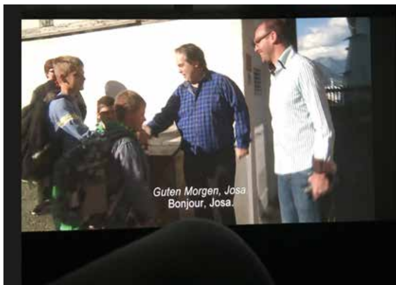
Scena or dal film «Mo il tic tac da l'ura» che RTR ha mussà a Soloturn.