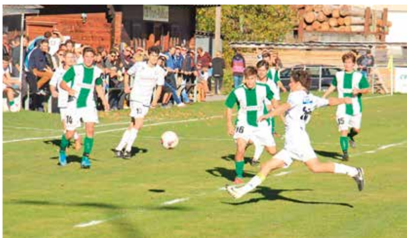
Las duas equipas da Trun/Rabius e Danis-Tavanasa durant il derby l'atun 2015.